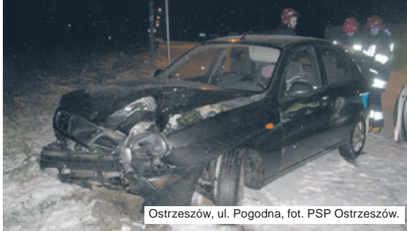
Ostrzeszów, ul. Pogodna, fot. PSP Ostrzeszów.

25 stycznia, po 4.00 nad ranem dyżurny policji otrzymał zgłoszenie o zdarzeniu drogowym, do którego doszło w Rojowie. 18-letni mieszkaniec gm. Ostrzeszów, kierujący samochodem marki Opel Astra, nie dostosowa-