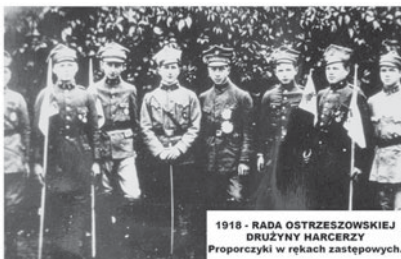
1918 - RADA OSTRZESZOWSKIEJ DRUŻYNY HARCERZY Proporczyki w rękach zastępowych.

nę skautową, liczącą ok. 30 członków, zakłada w 1914r. Witold Modrzejewski, uzyskując zrozumienie i poparcie osób dorosłych. Zbiórki i szkolenia odbywały się w sposób niejawni, kształtując postawę moralną i patriotyczną przygotowując do oczekiwanych działań niepodległościowych. Ważnym dowodem na powyższe informacje są autentyczne podpisy: Gwiżdździela, Tomczaka,